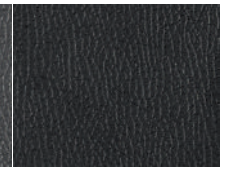
LT 디렉스 / LTZ 고급 블랙 가죽시트

* 위 이미지는 시트색상 참조용이며, 실제 이미지는 트림 및 사양구성에 따라 달라질 수 있습니다.