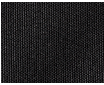
LS / LS 디렉스 직물시트