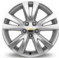
18인치 알루미늄 휠