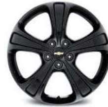
19인치 블랙 알루미늄 휠