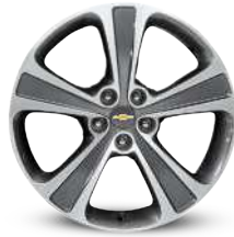
19인치 투톤 알루미늄 휠