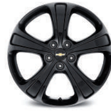
19인치 블랙 알로이 휠