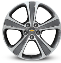
19인치 투톤 알로이 휠