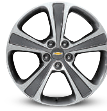
19인치 투톤 알로이 휠