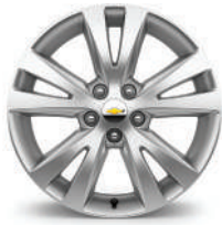
18인치 알로이 휠