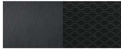
LT 인조가죽 시트 + 고급 블랙 직물시트