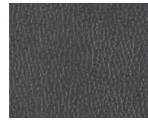
LT 디렉스 / LTZ 고급 블랙 가죽시트

* 위 이미지는 시트색상 참조용이며, 실제 이미지는 트림 및 사양구성에 따라 달라질 수 있습니다.