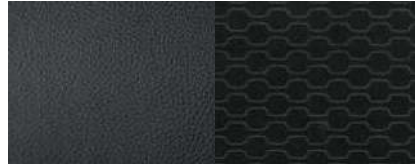
LT 인조가죽 시트 + 고급 블랙 직물시트