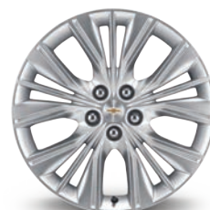
20인치알로이 휠 (3.6L 스마트 드라이빙 팩 전용)