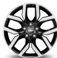
19인치 블랙 나이트 투톤 휠 (미드나이트 블랙 에디션 전용)