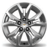
18인치 알로이 휠 (LT)