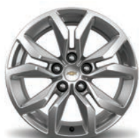
18인치알로이 휠 (LT)