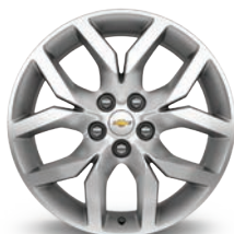
19인치알로이 휠 (LTZ)