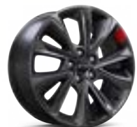
17 인치 Redline 시그니처 알로이 휠