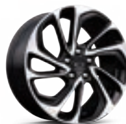
17 인치 머신드 블랙 투톤 알로이 휠