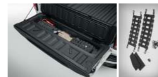
테일 게이트 오가나이저 : 150,000