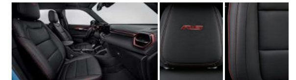
젯 블랙 & 레드 포인트 인테리어 (RS)

※ 상기 이미지는 컴포트 패키지 선택 시 천공 천연 가죽시트가 적용된 이미지임 (Premier)