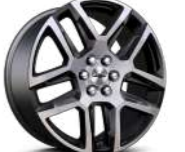
20인치 다크 안드로이드 알로이 휠