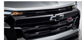
LED 블랙 보타이(전면)