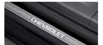
도어 실 플레이트 : 160,000