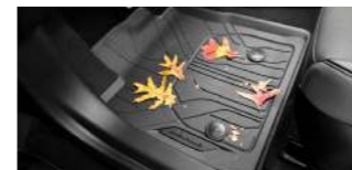
올웨더 플로어 라이너 (1열/2열) - 2WD : 72,000