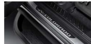
콜로라도 로고 도어 실플레이트(1열)