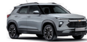
스털링 그레이 (GZB)