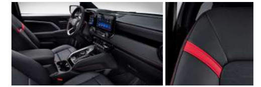
젯블랙 아드레날린 레드 포인트 인테리어 (천연 가죽 시트)