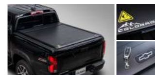
슬라이딩 적재함 커버(자동) : 1,520,000