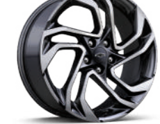
19인치 카본 플래시 머신드 알로이 휠 (RS 전용, 스위처블 AWD 패키지 선택시 적용)