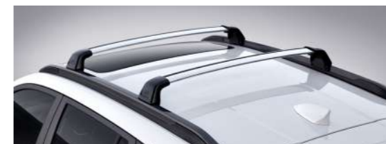
루프 크로스 바