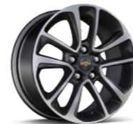
17인치 머신드 알로이 휠 (Premier 전용)