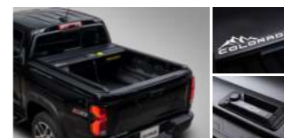
슬라이딩 적재함 커버(수동) : 1,140,000