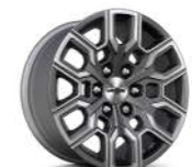
18인치 안드로이드 다크 글로스 알로이 휠