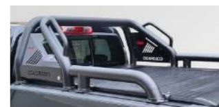
롤 바 : 680,000