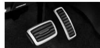
스포츠 페달 패키지(브레이크, 엑셀레이터) : 71,000