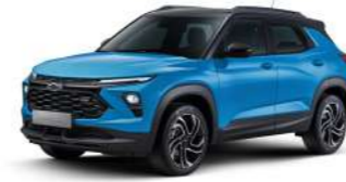
NEW 마리나 블루 (GKN)