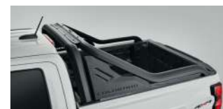
블랙 스포츠 바 : 2,000,000