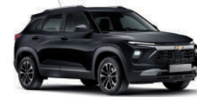
모던 블랙 (GB0)