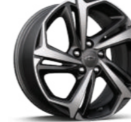
18인치 머신드 알로이 휠 (RS 전용)