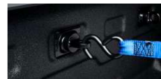
적재함 고리 세트 (구성: 4 pcs) : 130,000