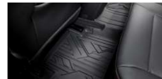
프리미엄 플로어라이너(1열 & 2열)