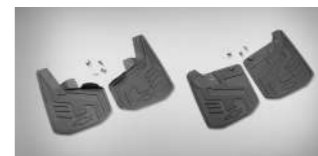
플랫 매트 가드(프론트 & 리어) : 260,000