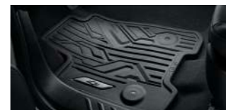
올웨더 플로어 매트(1열 & 2열) : 220,000