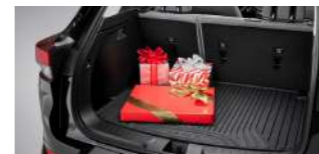
올웨더 트렁크 매트 : 44,900