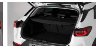
롤라입 라커지 세트 : 81,280