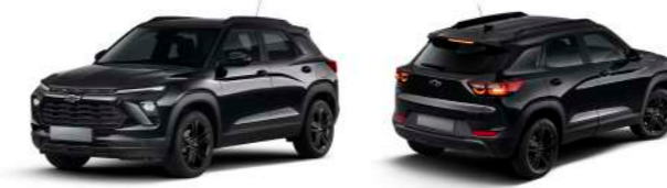
모던 블랙(GB0) 외장컬러 전용