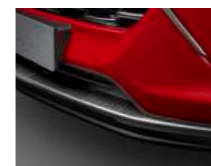
카본룩 프론트 스키드 플레이트 인서트