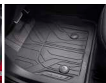
올웨더 플로어 라이너 (1열 & 2열)