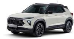
모카치노 베이지 (G42)