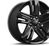
18인치 블랙 알루미늄 휠 (Premier 전용, 미드나잇 에디션 패키지 선택시 적용)