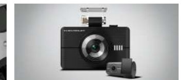
Dual FHD 블랙박스 GM-F64 : 330,000 (장착비 별도)