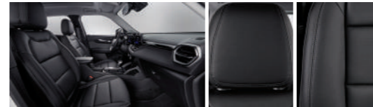
젯 블랙 & 빅토리아 헤링본 포인트 인테리어 (Premier)