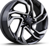
19인치 카본 플래시 머신드 알루미늄 휠 (RS 전용, 스위처블 AWD 패키지 선택시 적용)