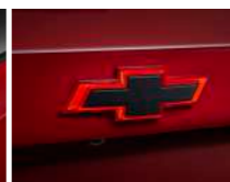
리어 레드 LED 블랙 보타이