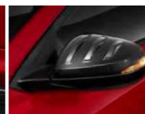
카본룩 아웃사이드 미러 커버