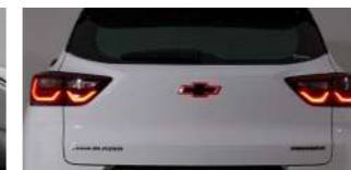
레드 LED 블랙 보타이(후면) : 139,100