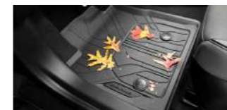
올웨더 플로어 라이너 (1/2세트) : 72,000