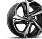
18인치 머신드 알루미늄 휠 (RS 전용)