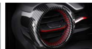
카본룩 스포츠 트림 커버 및 9중