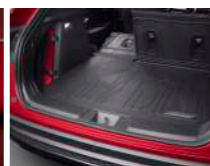
올웨더 카고 라이너