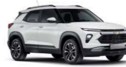
퓨어 화이트 (GAZ)