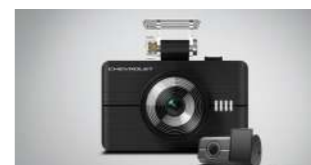
Dual FHD 블랙박스 GM-F64 : 330,000 (장착비 별도)