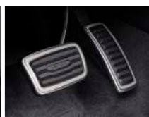
스포츠 페달 커버