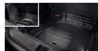
트렁크 라지 트레이 : 79,000