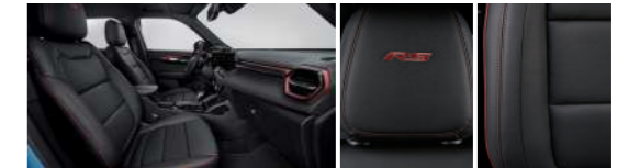
젯 블랙 & 레드 포인트 인테리어 (RS)

* 상기 이미지는 컴포트 패키지 선택 시 천공 천연 가죽시트가 적용된 이미지임 (Premier)