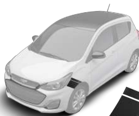
스포츠 데칼 (모던 블랙 루프 선택시)