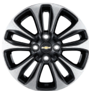
15인치 블랙 투톤 알루미늄 휠 (RRK)