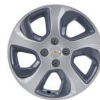
16인치 그레이 인서트 실버 알루미늄 휠 (NWK)