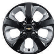
15인치 그레이 인서트 블랙 알루미늄 휠 (5PL)