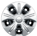
14인치 스티 휠