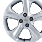
16인치 알로이 휠