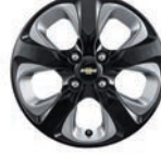
15인치 그레이 포인트 블랙 휠 (그래피티 에디션 전용)