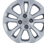
15인치 알로이 휠