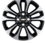
15인치 블랙 투론 휠 (LTZ 에코 전용)