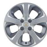
15인치 그레이 인서트 실버 알루미늄 휠 (5PM)