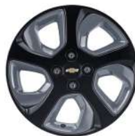
16인치 그레이 인서트 블랙 알루미늄 휠 (NWQ)