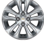
15인치 알로이 휠