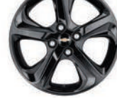
16인치 블랙 휠 (퍼펙트 블랙 전용)