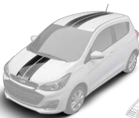
스트라이프 데칼 (후드 & 루프)