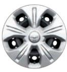
14인치 스틸 휠