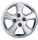
14인치 알로이 휠