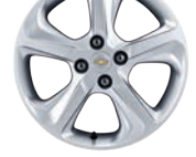
16인치 알로이 휠