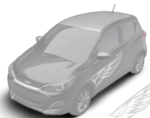
윙 데칼 (모던 블랙/퓨어 화이트 루프 선택시)