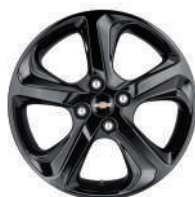
16인치 블랙 알루미늄 휠 (P1B)