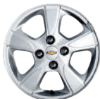
14인치 알로이 휠