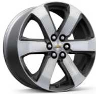
20인치 테크니컬 그레이 포켓 머신드 알로이 휠 (LT Leather & LT Leather Premium 적용)