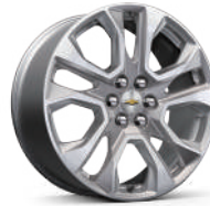
20인치 아전트 메탈릭 머신드 알로이 휠 (Premier 적용)