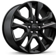
20인치 다크 안드로이드 페인티드 알로이 휠 (RS 적용)