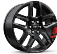
20인치 레드라인 시그니처 블랙 알로이 휠 (레드라인 전용)