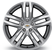
19인치 울트라 브라이트 전면가공 알로이 휠 (LT & LT Plus & Premier Exclusive)