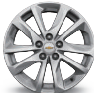
18인치 알로이 휠 (LT & LT Plus 기본)