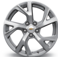
18인치 전면가공 알로이 휠 (Premier 기본)