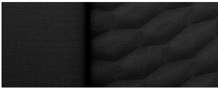
데님 직물 시트 LS