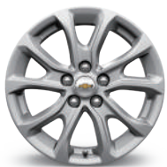
17인치 알로이 휠 (LS 기본)