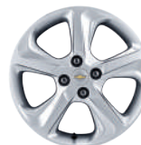
16인치 알로이 휠