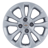
15인치 알로이 휠