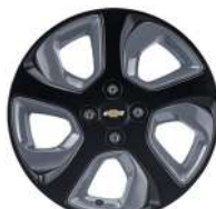
16인치 그레이 인서트 블랙 알루미늄 휠 (NWQ)